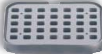
4 T 35 viereckig