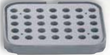
5 T 35 achteckig