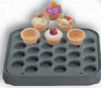
9 T 24