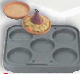
2 T 5