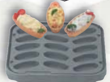
3 Schiffchen T 15