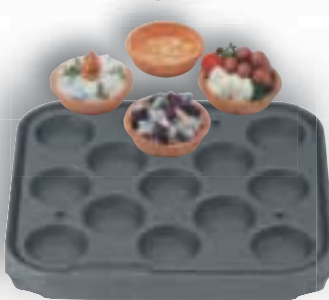
8 T 13