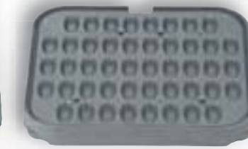
10 Schiffchen T 46