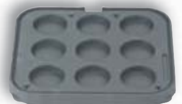
7 T 9